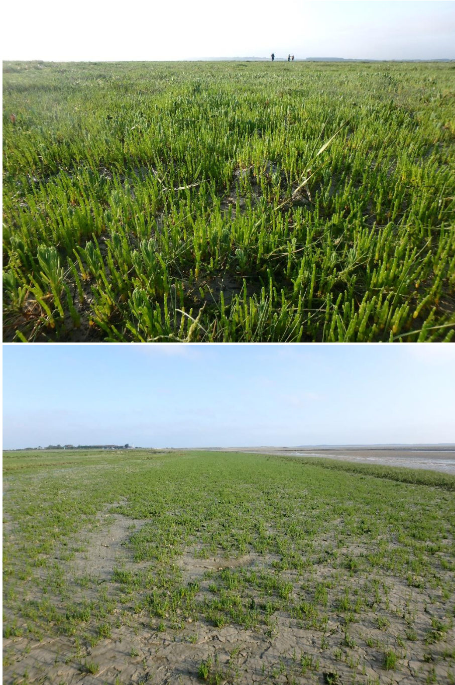
Figure 2 : Platières à salicornes

De belles zones ont été identifiées, permettant aux pêcheurs de reprendre leur activité. L'ensemble des participants à la commission, CRPMEM et GEMEL compris, est d'avis d'ouvrir la pêche aux salicornes à la date du 9 juin 2023 (Figure 2).