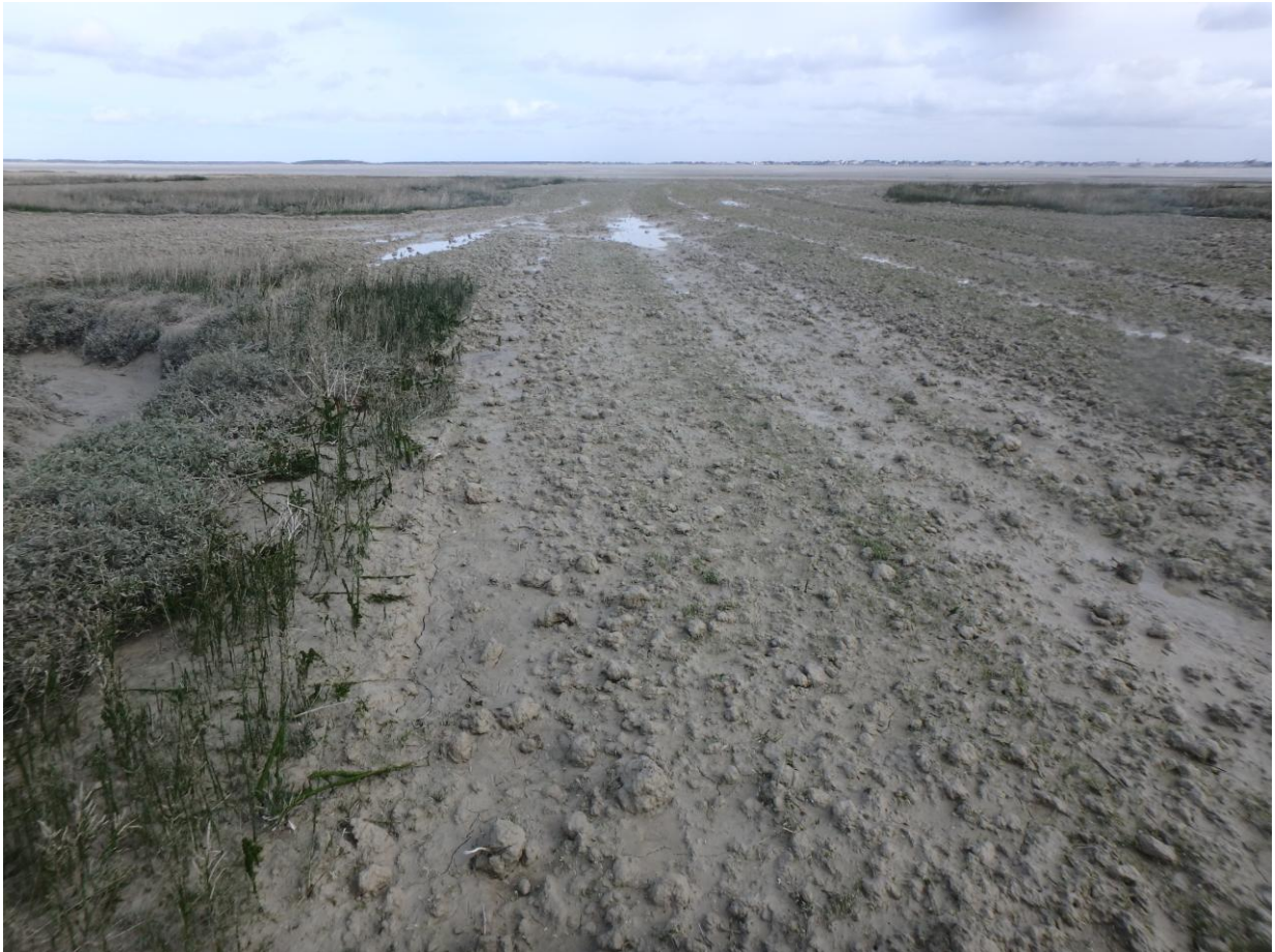
Figure 3 : Travaux réalisés au Hourdel illustrant le bon travail de labourage et le respect des filandres et des zones à obione