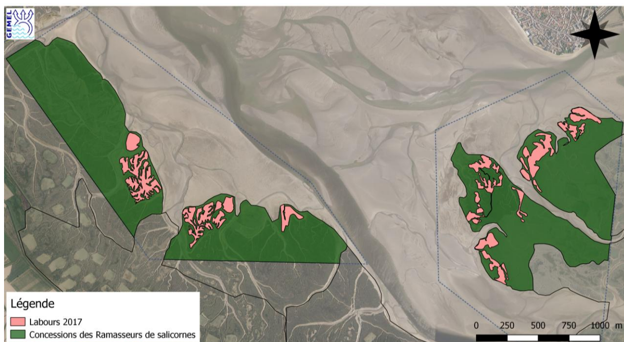
Figure 2 : Cartographie de l'ensemble des zones travaillées dans les concessions en 2017. Coordonnées exprimées en Lambert 93.