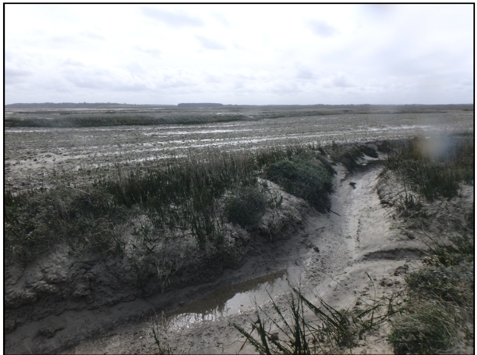
Labours réalisés au Hourdel, hiver 2017

Rapport du GEMEL n°17-003 19 octobre 2017