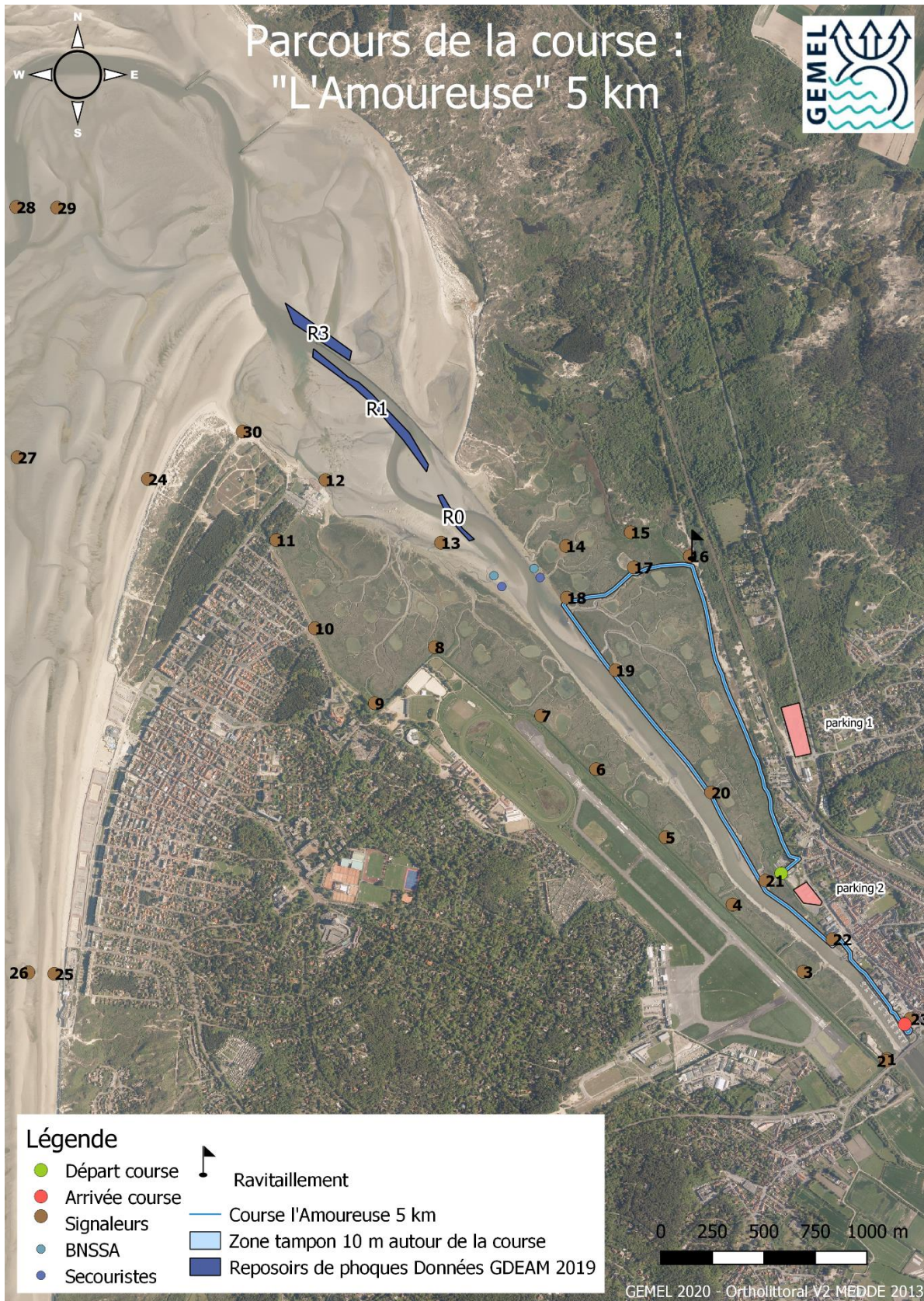
Figure 2 : Tracé du parcours de la course « l'Amoureuse » de 5 km. Carte extraite de l'étude d'incidence de 2020.