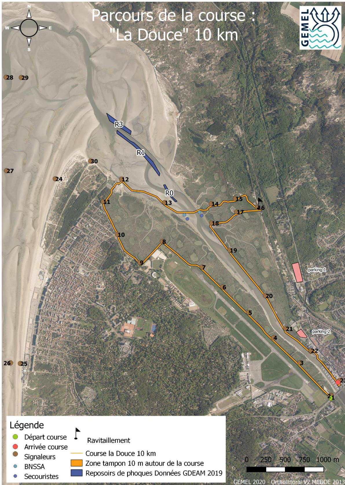
Figure 3 : Tracé du parcours de la course « la Douce » de 10 km. Carte extraite de l'étude d'incidence de 2020.