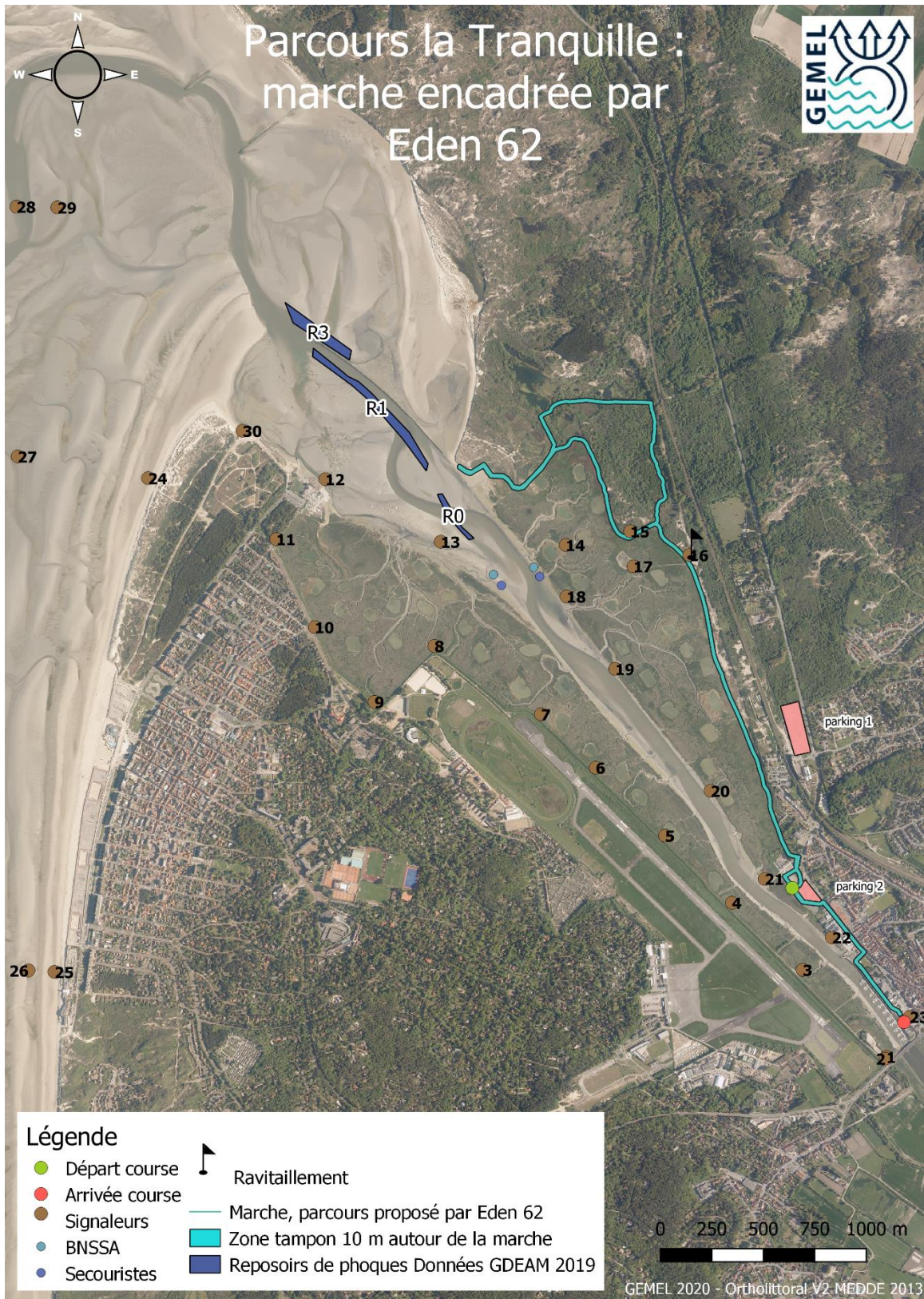
Figure 1 : Tracé du parcours de la marche « la Tranquille » de 9 km encadrée par Eden 62.