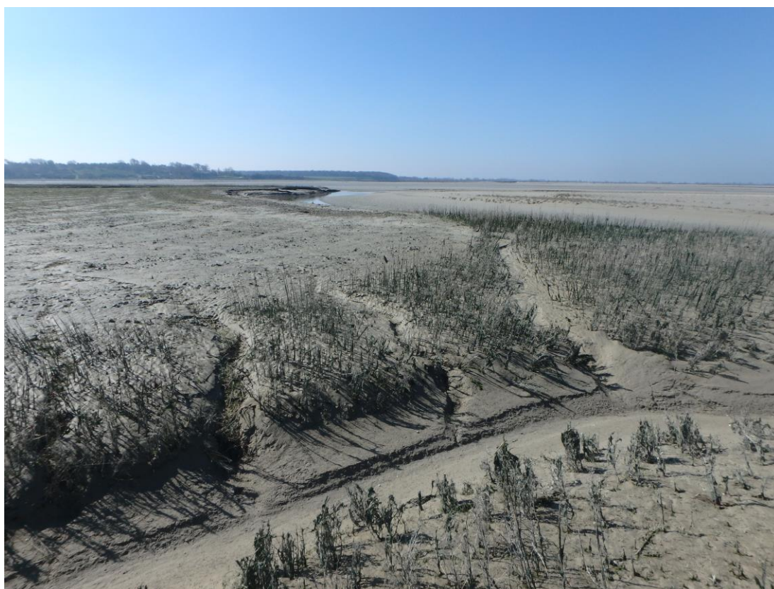
Figure 3 : Photographie de labours au Crotoy 2019