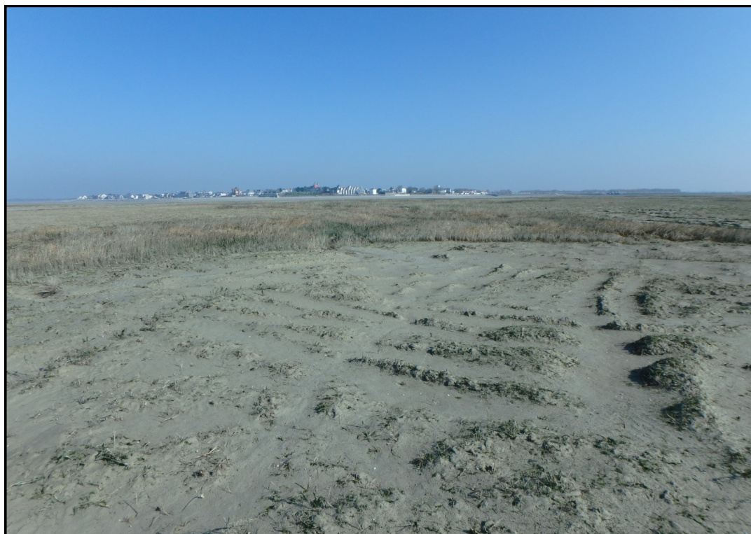
Labours réalisés au Crotoy en 2019

Rapport du GEMEL n°19-013 4 septembre 2019